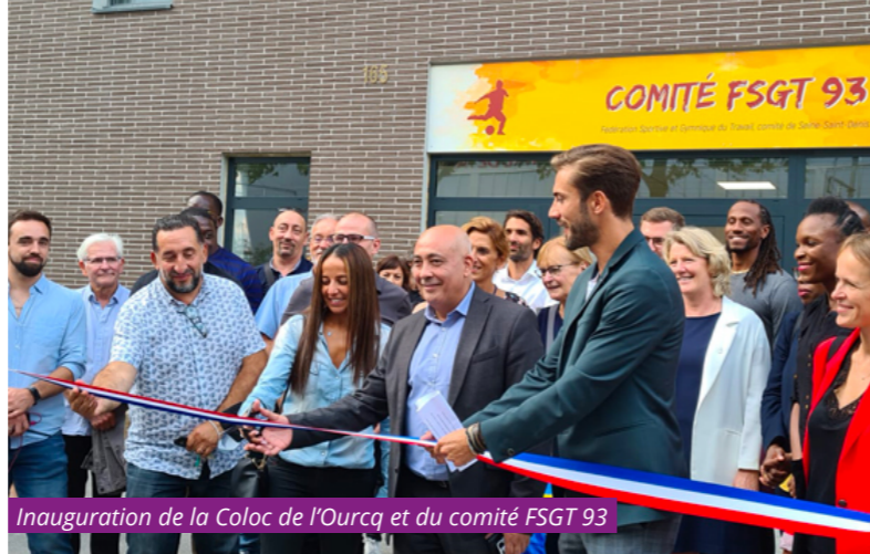
Inauguration de la Coloc de l'Ourcq et du comité FSGT 93

Pour suivre l'actualité du projet, rendez-vous sur : est-ensemble.fr / ville-romainville.fr / sequano.fr / Plaine de l'Ourcq